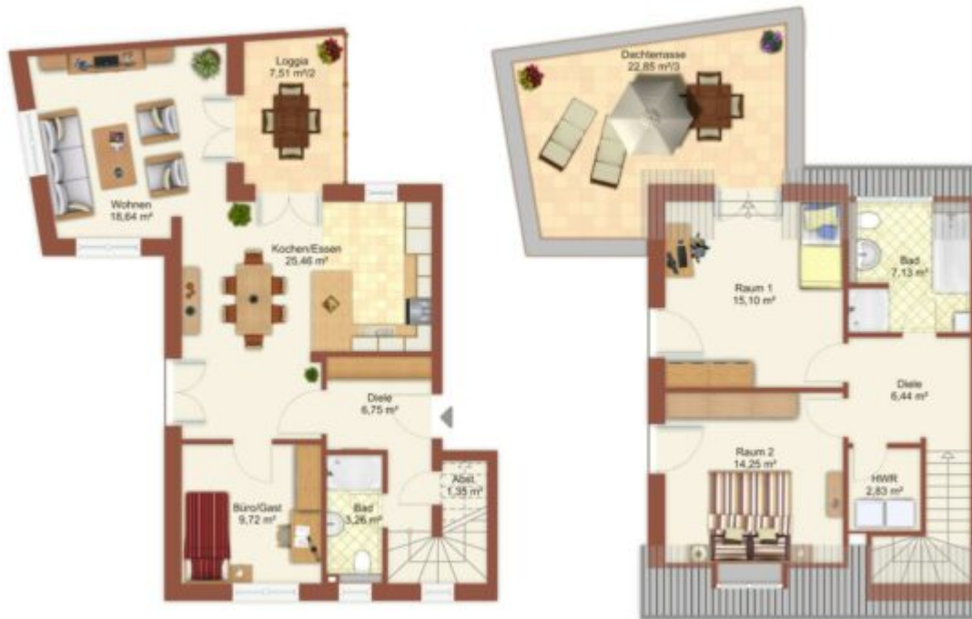
Luzienstraße, Maisonette links, OG und DG

Wenn Sie das Haus betreten, gelangen Sie über eine formschöne breite Treppe ins Obergeschoß; hier wenden Sie sich nach links und gelangen in Ihre Wohnung. Es empfängt Sie eine geräumige Diele incl. Garderobennische. Die Diele bietet Zugang zum Gäste-Bad und zu den Räumen Büro/Gast und Kochen/Essen und Wohnen. Dieser eben genannte Bereich ist optisch von Essbereich abgetrennt und bietet Ihnen Platz zum Entspannen, Fernsehen oder zum sich unterhalten.